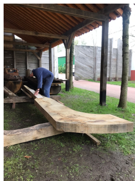
Klaarmaken voor aanpassingen