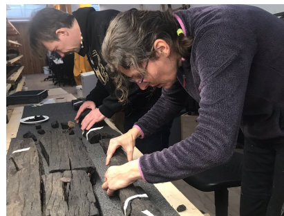
Robin en Yardeni plakken andere delen