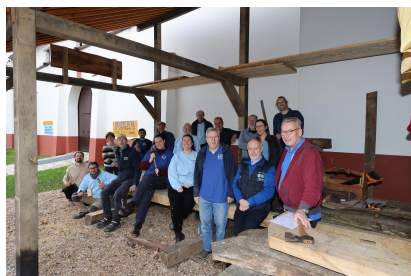
Op de foto een deel van alle medewerkers en vrijwilligers, onder de overkapping van het nieuwe Navalía Nigrum Pullum. Vanwege de lockdown is de gezamenlijke kerstfoto-op-afstand komen te vervallen.