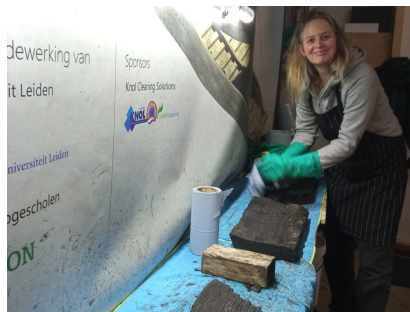
Carlien dept het hout droog